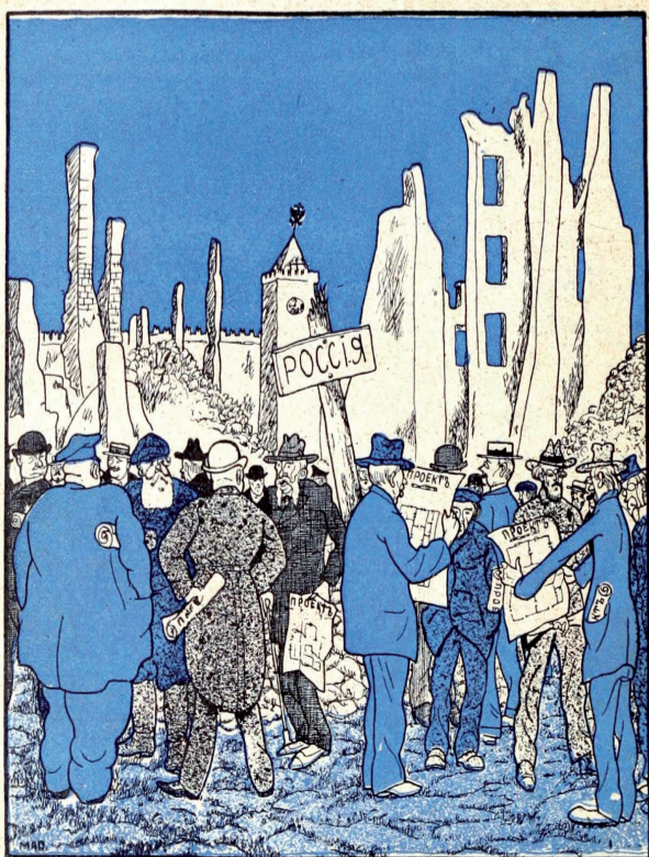
Столько архитекторов с проектами и ни одного каменщика...