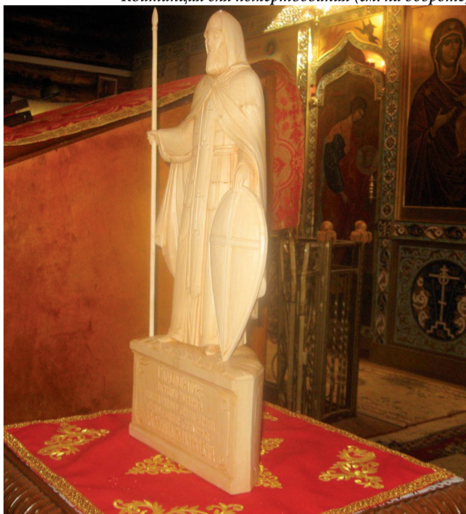
Главный приз турнира