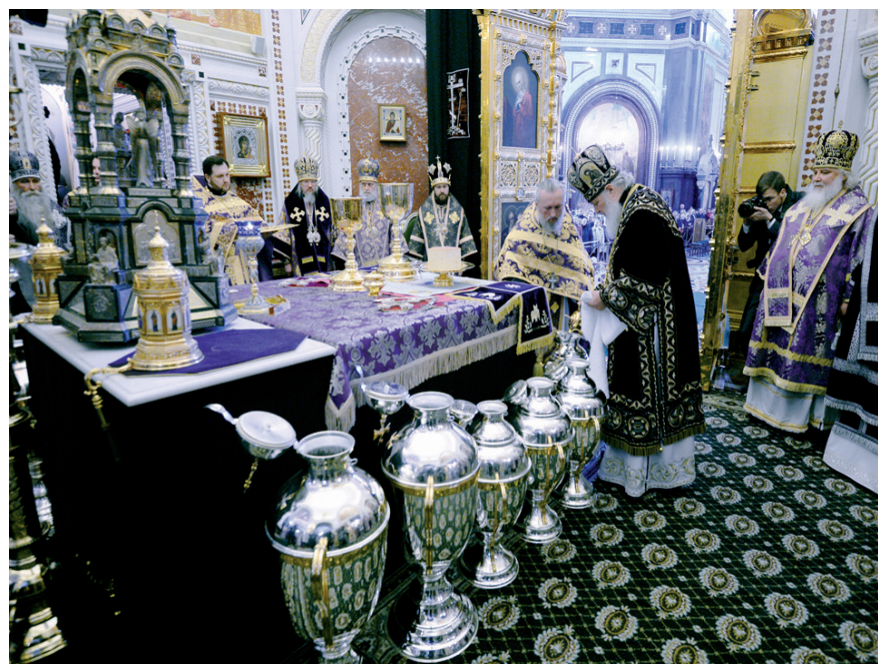
Освящение мира в Великий Четверг