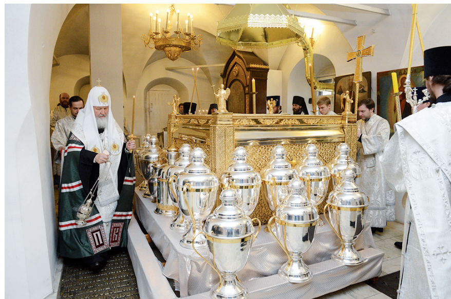
Молебен на начало мироварения

Миро, как было сказано выше, представляет собой смесь благовонных масел. В ветхозаветную пору им помазывались Скиния, первосвященники, пророки и цари. Жены-мироносицы шли ко гробу Господа Иисуса Христа именно с таким миром. Миром помазуют в случаях, когда приобщаются к православию инославные христиане. Миро употребляют и для освящения новых