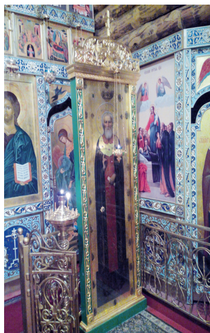
Икона при. Сергия с частицей мощей

бо молиться и соблюдать уставы Церкви, а Он через благоухание свидетельствует Своё благоволение к нашим грешным молитвам. Вокруг много соблазна, люди не молятся и не ходят в храм, постов не соблюдают, исповедуются и причащаются редко. Малодушные смотрят на таких людей, соблазняются и говорят: «А почему им можно, а нам нельзя?!». И, к сожалению, некоторые осла-