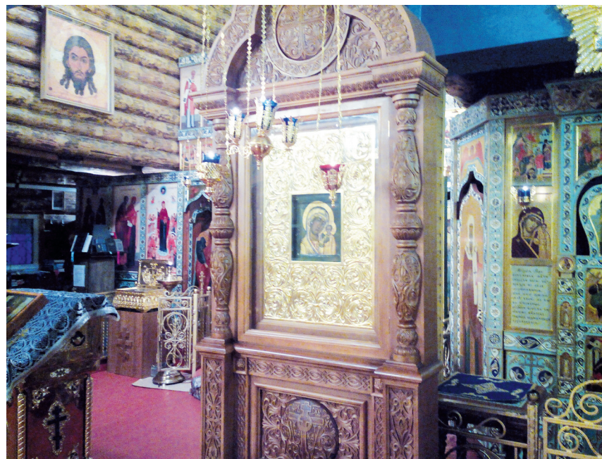
Чудотворная Казанская Икона из нашего храма

дый день благоухали разные иконы, и бывало так, что начинали они благоухать прямо на глазах у многих прихожан так выразительно, что не было никакого сомнения. Потом постепенно аромат пропадал, и становилось всё по-прежнему, а икона св. Николая благоухает, не переставая, уже 5-ю неделю. Многие спрашивают: к чему это? Пока окончательные выводы делать рано. Тем более, что мы понять это мы можем только своим грешным умом. Господь рано или поздно Сам явит нам Свою милость и ответит на этот вопрос. Пока можно сказать, что иконы стали благоухать после сугубых молитв прихожан, дополнительных молитв в храме и молебнов. Все на нашем приходе молятся Божией Матери о помощи в строительстве на территории подворья будущего каменного храма в честь Ее иконы Иверской, многие несут различные послушания, помогая больным и нуждающимся, прихожане старательно соблюдают Великий Пост, часто исповедуются и причащаются. Господь в ответ посылает нам Своё благословение, и чтобы мы, грешные, поняли это, иконы начинают благоухать во время молитвы. Так Господь подкрепляет нас в том, что и впредь нам надо сугубо