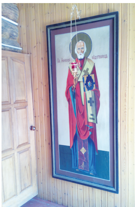
Икона свт. Николая в притворе

Этот Великий пост ознаменовался для Пересветовского подворья несколькими чудесными событиями: это и пребывание в нашем храме кровоточивого Казанского образа Божией Матери из Крыма, и сапожка от мощей свт. Спиридона Тримифунского, и благоухание некоторых икон. О смысле и значении этих явлений в нашей духовной жизни в своей статье рассуждает настоятель Пересветовского подворья протоиерей Константин Харитонов.