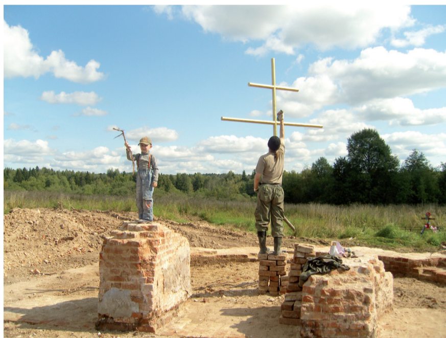
Фундамент разрушенного храма в Малыгино

28 июля – память св. равноапостольного князя Владимира. 1025 лет Крещения Руси