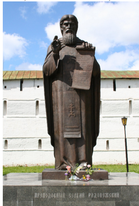
Памятник прп. Сергию возде Лавры

Почему собрались вокруг преподобного Сергия, в далеком XIV веке, на этой самой земле, на ко-