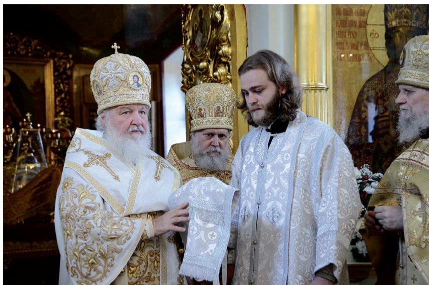
Святейший Патриарх Кирилл совершает иерейскую хиротонию

Нет власти у священника; нет прав у священника; есть только страшная и дивная, подлинно божественная привилегия — любить до смерти и смерти крестной. Кто-то из западных писателей, спрошенный, что такое священник, ответил: Священник — это распятый человек... Человек, который отрекся и отрекается, и каждый час должен заново отречься от себя, от каких бы то ни было прав; не только от ложного права творить зло и быть грешником, но даже от законных прав человечности, человеческой жизни. Он — образ Христов, он — икона, он — Христова забота, он — Христова любовь; он — Христово тело, которое может быть распято; он — Христова кровь, которая может быть излита.