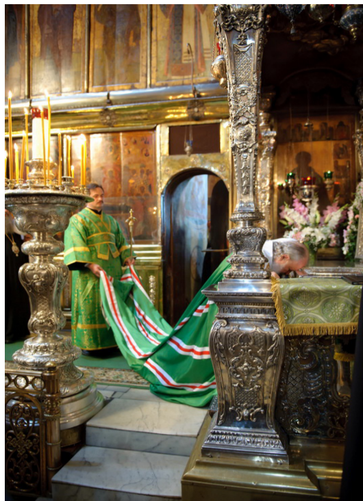
Святейший Патриарх у раки Преподобного

Всех вас, дорогие отцы, братья и сестры, сердечно поздравляю с великим для всех нас праздником памяти святого преподобного и богоносного отца нашего Сергия, игумена Радонежского, чудотворца, к которому мы притекаем с верой и молимся пред его мощами. Преподобный слышит эту молитву и великой силой, которая дана ему от Бога, делится с нами. И получаем мы по нашим молитвам