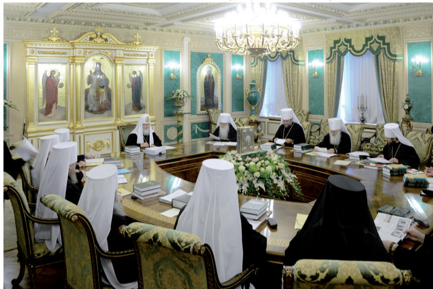
Заседание Священного Синода Русской Православной Церкви от 16 июля 2013 года

Мы должны усвоить уроки прошлого. И главный из них таков: здание нашей цивилизации не может существовать без евангельского фундамента, на котором оно было возведено. Сегодня многие вновь предлагают нам строить жизнь без Бога. Свободу подчас трактуют как следование любым желанием, в том числе внушенным человеку извне. Такое понимание свободы может расширяться до пределов, когда она начнет угрожать и естественному нравственному чувству, и долгу перед ближними, и, в конечном итоге, самой возможности говорить правду и поступать