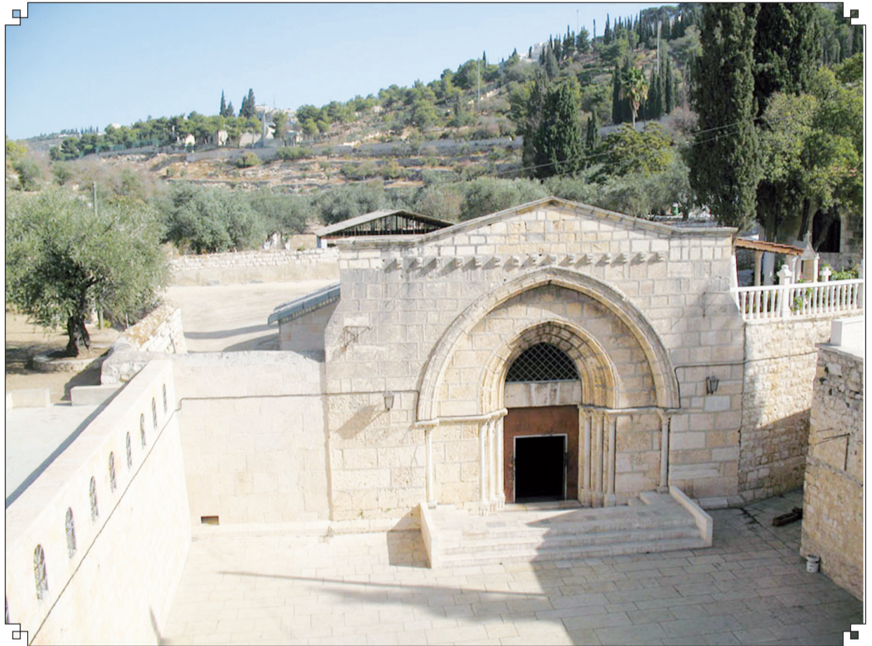
Вход в храм Успения Пресвятой Богородицы в Иерусалиме