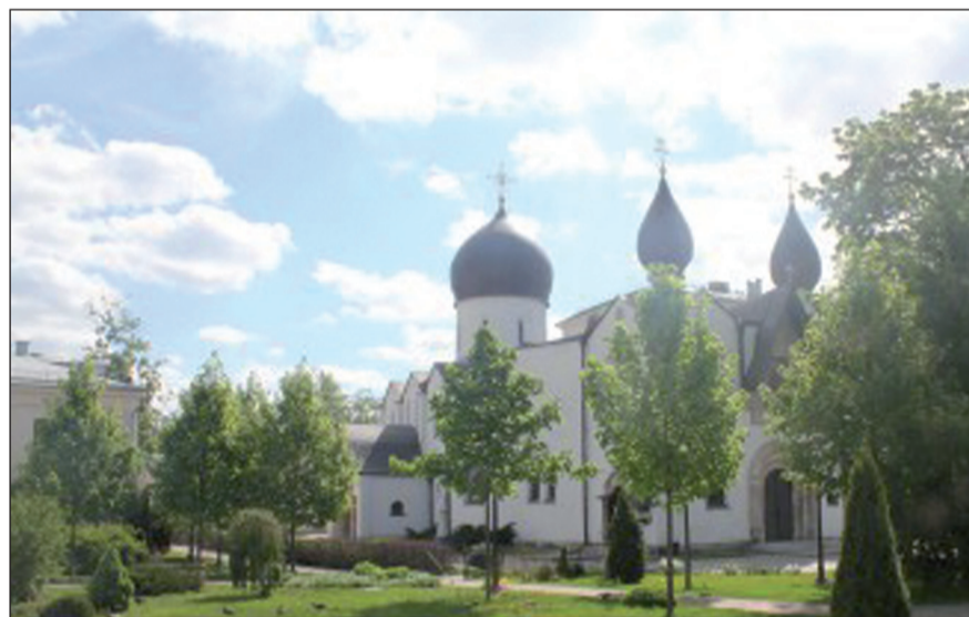
Покровский храм в Марфо-Мариинской обители