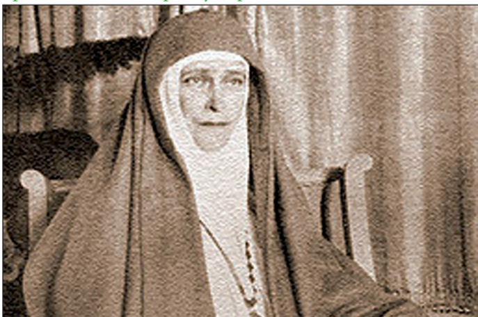
Великая княгиня Елисавета Феодоровна в последние годы жизни

5 февраля 1905 г. от взрыва бомбы революционера-террориста погиб Великий князь Сергей Александрович. В час тяжелого испытания Елисавета Феодоровна просила помощи и утешения у Бога. Великая княгиня Мария Павловна потом напишет, что никогда не забудет лица тети после панихиды. Бледная, с сухими глазами, прижав к себе детей, она повторяла одно и то же: «Он так вас любил, так любил...». И в последующие дни она находилась в каком-то оцепенении, ничего не ела, ночи проводила в молитве.