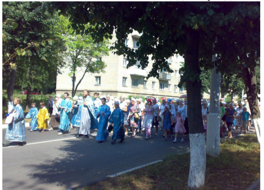
Крестный ход в Малыгино с чудотворным Казанским образом (21 июля)

торой числилось 157 мужчин и 186 женщин, все православные. При церкви действовала церковно-приходская школа, в которой