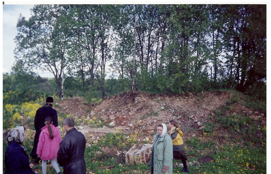
На месте разрушенного храма, май 2001 г.