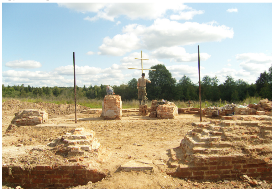
Фундамент храма после раскопок в августе 2009 г.

Церковь была достаточно снабжена утварью, ризницей и святыми иконами, из которых наиболее примечательна Казанская икона Божией Матери очень древнего письма в серебряной вызолоченной ризе с короной из жемчуга и разноцветных камней. Местными прихожанами и жителями окрестных селений эта икона считалась чудотворной. Другой старинной иконой в Ма-