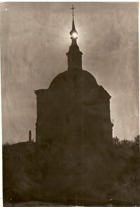
Храм в Малыгино незадолго до разрушения

Мы, жители Пересвета – города, не имеющего пока долгой истории ни гражданской, ни духовной, тем не менее, не находимся в стороне от духовного наследия, которым богата наша земля. Конечно, важнейшим является дело преподобного Сергия – его обитель, и поныне остающаяся средоточием духовной жизни Русской Церкви и, в особенности, Радонежской земли. Но для нас ближайший кладезь этого духовного наследия – храм и приход, в течение трехсот лет существовавший в Малыгино. Последний настоятель этого храма был расстрелян большевиками 80 лет назад, а сам храм был разобран жителями поселка Новостройки, но бесценное сокровище этого прихода – чудотворный Казанский образ Божией Матери был вверен Царицей Небесной именно нам, как видимое знамение духовной преемственности между нами и нашими благочестивыми предками. Стоит ли говорить, сколь важно для нас помнить и сохранять эту связь с Малыгинским храмом? Вниманию читателя предлагается краткая историческая справка об этом приходе.