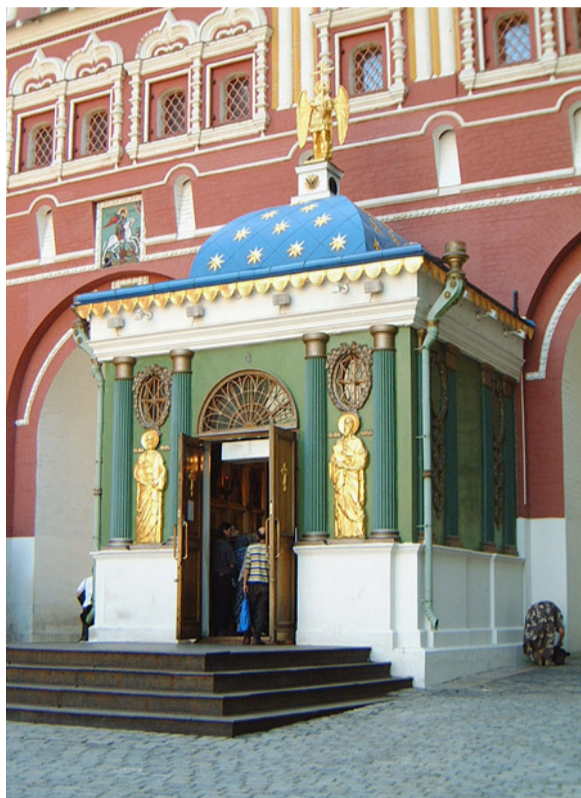
Иверская часовня у Воскресенских ворот (Москва, Красная площадь)

26 октября – празднование Иверской иконе Божией Матери, престольный праздник Подворья