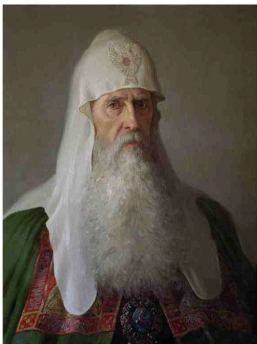
св. патриарх Ермоген

Еще при жизни святитель успел распорядиться, чтобы в ополчение была принесена Казанская икона Божией Матери. Перед ней молились Минин и Пожарский, она сопровождала ратников в походе. 14 августа 1612 года ополчение остановилось у Троице-Сергиевского монастыря, поджидая отставших. 18 августа, в день выступления ополчения к Москве, был отслужен молебен, тотчас по окончании которого внезапно переменялся ветер: из сильного встречного стал силь-