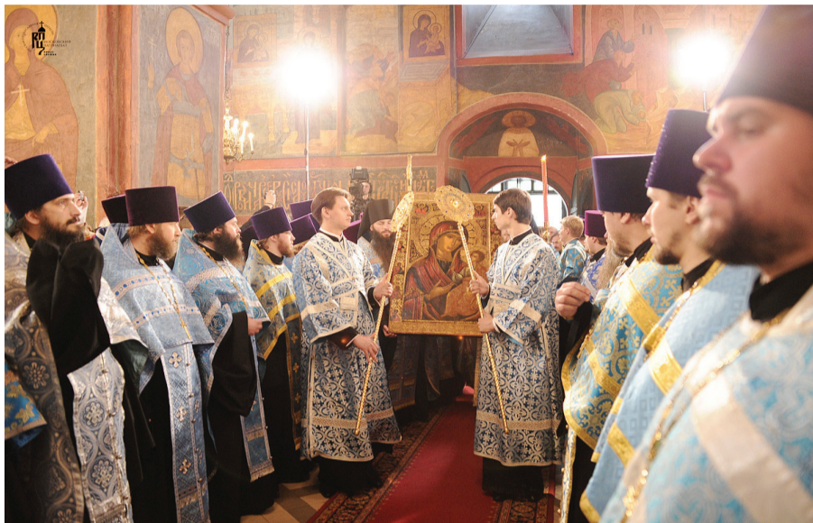
Передача списка Иверской иконы. Новодевичий монастырь

Первоначально Вратарницу поставили в Успенском соборе Кремля, затем в домовомой церкви царицы Марии Ильиничны Милославской. В 1654 году образ был взят государем в военный поход, завершившийся разгро-