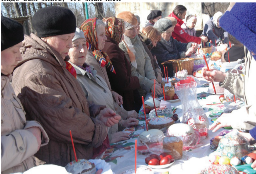
Освящение куличей. 2010 г.

составила Юлия Диденко