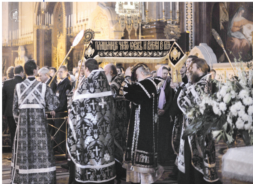
Великая пятница. Погребение плащаницы Спасителя

Вход Господень в Иерусалим - двенадцатый праздник, день торжественный и светлый, на время преодолевающий сосредоточенно-скорбное настроение Великого поста и предваряющий радость Святой Пасхи. В празднике Входа Господня в Иерусалим ярко загорается слава Христа как Всемогущего Бога, и как Царя, сына Давидова, Владыки, приветствуемого избранным народом Божиим. В этот день Церковь вспоминает, что пришедшие на праздник Пасхи иудеи встречали Иисуса как мессию, как пророка, как великого чудотворца, ибо знали, что Он незадолго до этого воскресил четверодневного Ла-