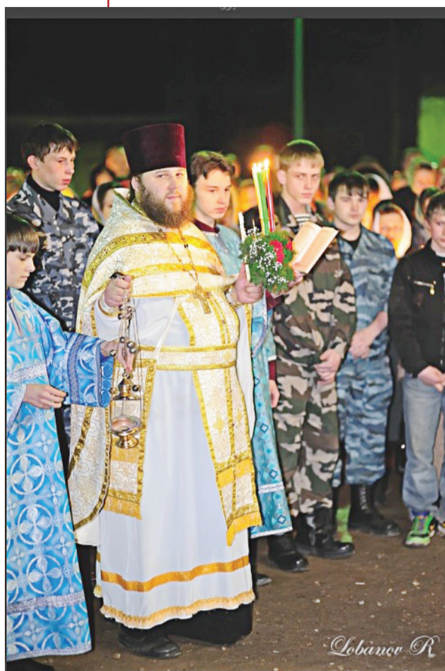
Пасхальный Крестный ход на нашем подворье. 2010 г.

В эту неделю вспоминается чудесное исцеление при овчей купели расслабленного - Иара, 38 лет томившегося от тяжелой болезни. Это чудо празднуется потому, что по преданию Христос совершил его во время празднования еврейской Пятидесятницы. В исцелении расслабленного Святая Церковь видит изображение обновления жизни всего человечества через Воскресение Христово.