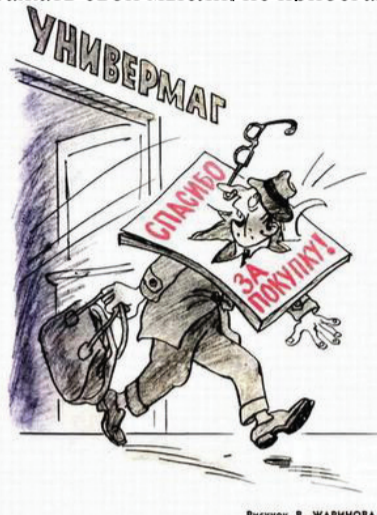
Рисунок В. ЖАРНОВА

пантомимики, выражений лица и телодвижений (грация). Особо выделяют культуру речи – умение грамотно, ясно и красиво выражать свои мысли, не прибегая к