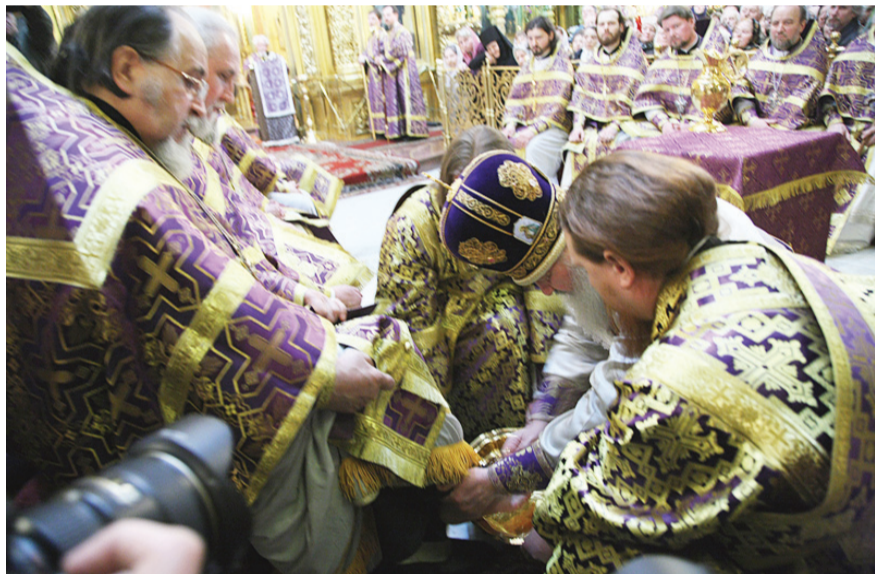
Святейший Патриарх Кирилл умывает ноги священникам. 2009 г.

Вспомните тогда то, что было в дни Страстей Христовых: сколько было народа, и добрых и страшных людей, которые много бы дали, чтобы вырваться из ужаса и из истомленности этих дней. Те, которые были близки ко Христу, – как у них разрывалось сердце, как истощались последние силы, телесные и душевные, в течение этих немногих страшных дней... И